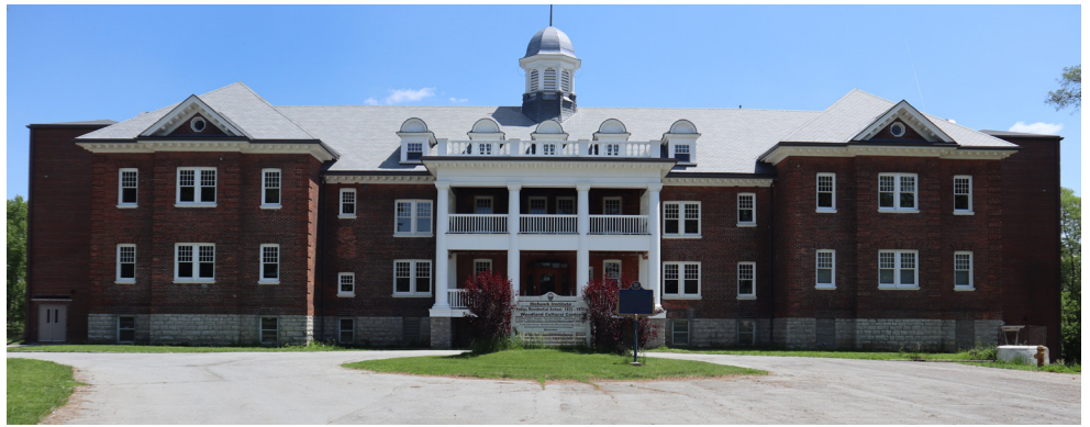
Le musée du Centre culturel Woodland (Brantford, Ontario), qui comprend l'ancien pensionnat Institut Mohawk, s'ajoute à notre réseau de Lieux passeport.

Visitez fiducienationalecanada.ca/rapport-annuel pour lire les histoires dans ce rapport annuel.