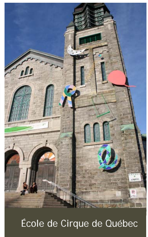
École de Cirque de Québec